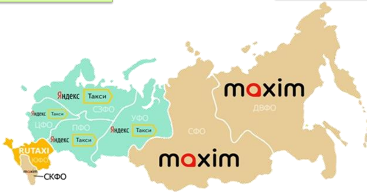
Популярность агрегаторов такси по федеральным округам