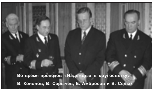
Во время проводов «Надежды» в кругосветку.

ступени административной работы управления эксплуатации морского флота. Последняя должность в ФЕСКО – заместитель генерального директора. В январе 2000 года он назначен на должность первого заместителя гендиректора самой крупной в нашей стране судоходной компании «Совкомфлот», где занимался вопросами эксплуатации сухогрузного флота, техническим и коммерческим менеджментом, курировал вопросы корпоративной компьютеризации. В конце 2002 года вернулся в ДВМП генеральным директором.