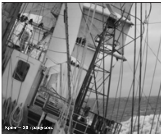
Крен – 30 градусов.

Во-первых, мы отметили первую годовщину, как стали морским университетом, в МГУ создан уже 12-й институт – МФТИ, расправили крылья институты менеджмента и Восточной Азии, появился новый тренажерный комплекс. И это далеко не полный перечень всего нового, что появилось в нашем университете. И, конечно же, главное событие этого года – кругосветка «Надежды». Впервые за всю историю нашего морского заведения учебное судно совершает такую грандиозную экспедицию. И обо всем этом «М» рассказывает в праздничном номере.