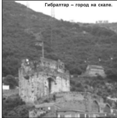
Гибралтар – город на скале.

Второй раз делать станцию в этом месте мы не рисковали. Мы планировали остаться на горе и сделать ночную станцию, чтобы провести лазерное зондирование верхнего слоя океана и лазерную батиметрию вершины горы. Начали монтировать систему для проведения этих работ на борту «Надежды», но к вечеру, когда опустили систему,