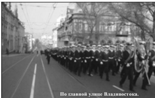
По главной улице Владивостока.

"Меридиан Морского государственного университета" – преемник "Меридиана", который выходит в МГУ с 20 декабря 1989 года (219)