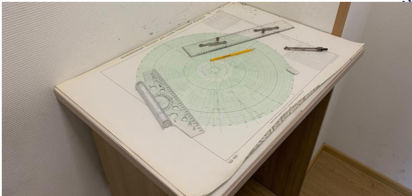
Штурманский стол учебного мостиков с №1 по №8