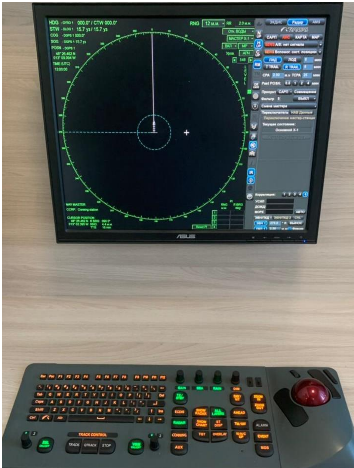
Станция РЛС и САРП мостиков с №1 по №8