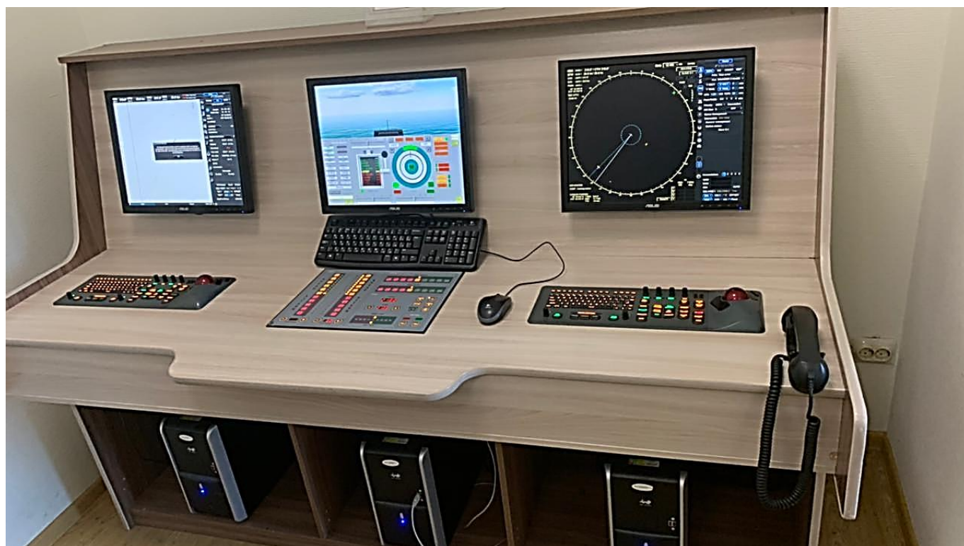
Учебный мостик с №1 по №8